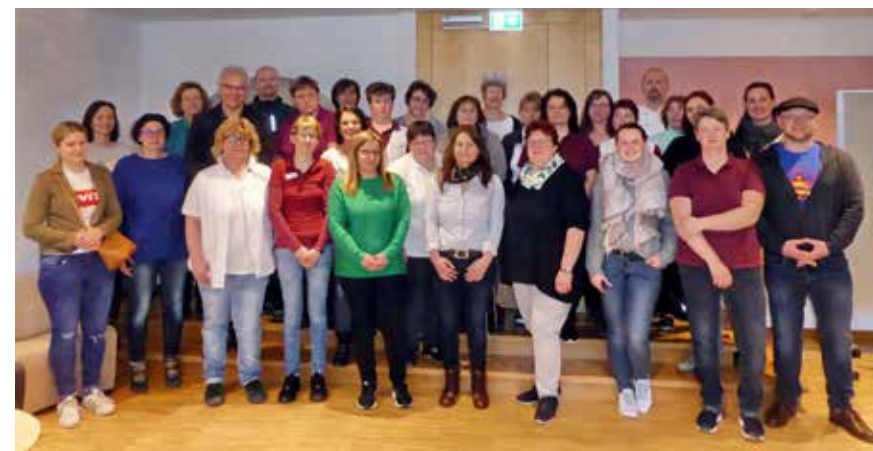
Gemeinschaftsprojekt „Grüner Gockel“ ein Projekt der gesamten Belegschaft unseres Hauses

Das EBZ Bad Alexandersbad weist derzeit eine Zahl von ca. 15.000 Übernachtungen auf. Dazu kommen eine Vielzahl von Tagesgästen bei eigenen Veranstaltungen und Veranstaltungen von Dritten.